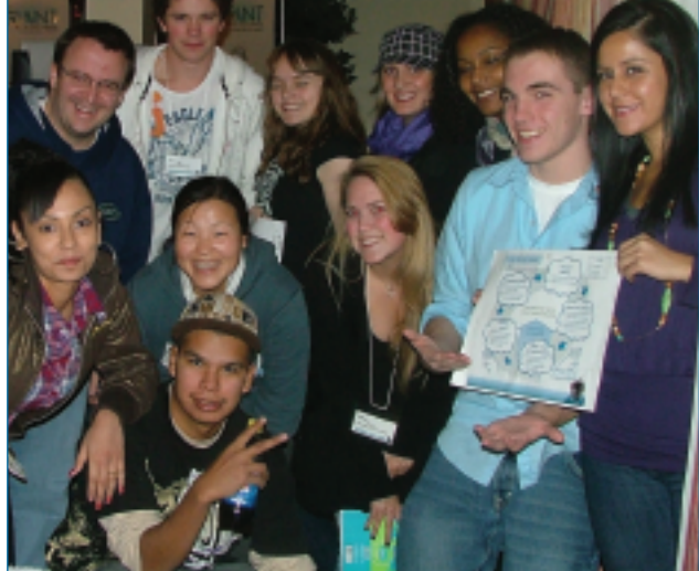
*Les quatre piliers de la Commission des étudiants sont Respecter, écouter, s'entendre et communiquer™.